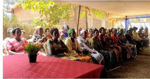
ניצולים ורוצחים יושבים ביחד בכפר פיוס