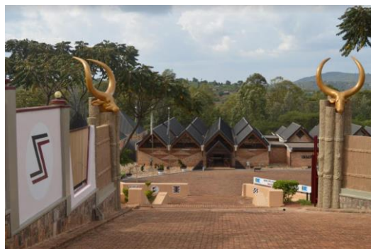
המוזיאון הלאומי לאנתרופולוגיה, Butare