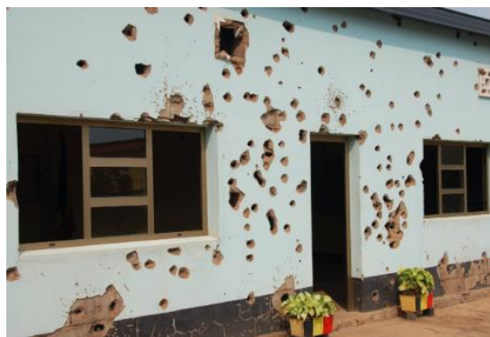
האנדרטה לזכר חיילי שמירת השלום מבלגיה

היום המשך הרצף ההיסטורי עם הגעת הקולוניאליסטים הראשונים, בשלהי המאה ה-19. סיור במוזיאון בית Kandt , הבית הראשון שהוקם בבירה החדשה של רואנדה, קיגאלי, ע"י המושל הראשון, הגרמני ריצ'ארד קאנדט. המשך לאנדרטה לזכר 10 חיילי שמירת השלום הבלגים שנרצחו ביום הראשון של רצח העם, טיול במדרחוב העיר. ביקור במוזיאון לאומנות של קיגאלי , ויציאה לעיר המחוז Bugesera וביקור בכנסייה ובאנדרטה של Nyamata שם נרצחו 10,000 בני הטוטסי בכמה שעות ב-10 באפריל 1994. ניפגש עם מנהל האתר ונשמע עדות של ניצולה. לינה – Chez Lando או דומה לו.