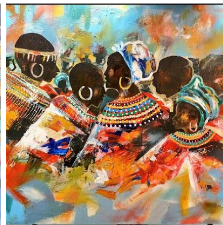
יצירות של אומנים רואנדים צעירים, מעיר המחוז מוסנזה בצפון