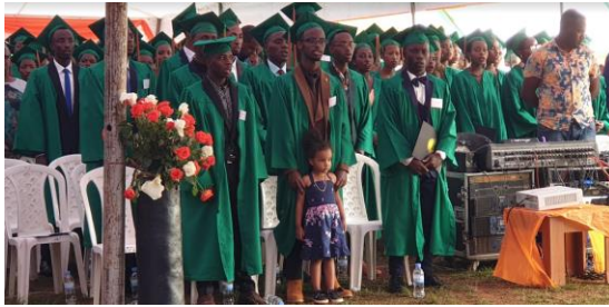
טקס סיום בית הספר "אגהוזו שלום"