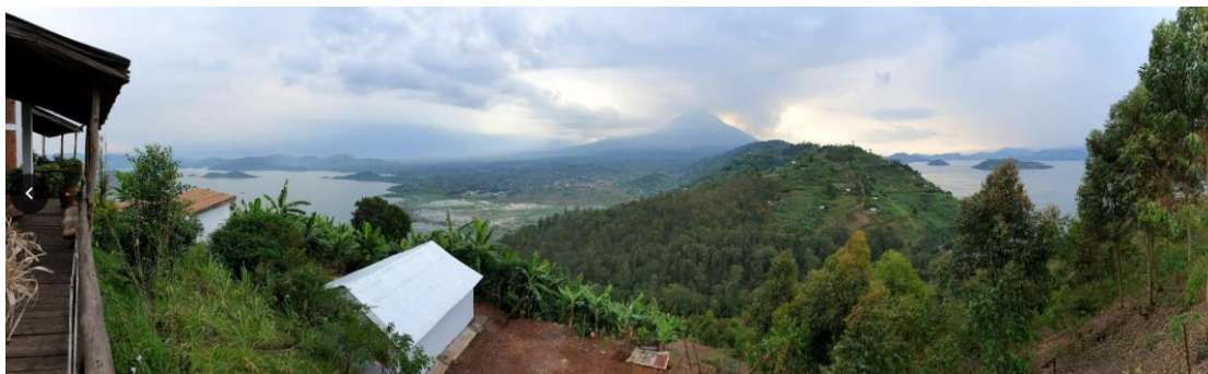
הנוף המרהיב של שני האגמים התאומים Ruhondo ו-Burera והר הגעש Muhavira