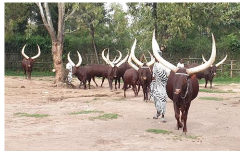
הפרות המלכותיות בארמון המלך