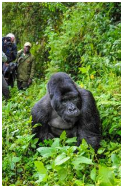
גורילות ההרים בשמורת הוולקנוס

לפנות ערב, סיור בכפר Red Rock ובו נגלה מסורות שונות של הרואנדים, טווית סלים, ייצור בירה מבננה, חקלאות מסורתית, ריקודים ואף נתנסה בחלקם. ארוחת ערב ולינה ב- Classic Resort או דומה לו.