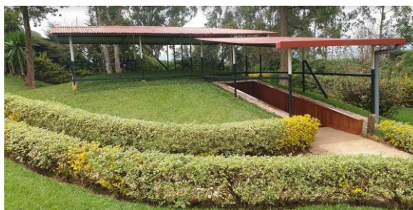
הבונקר של קגאמה, Mulindi סמוך לאוגנדה