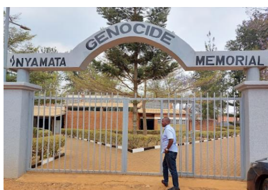
אתר ההנצחה ב-Nyamata