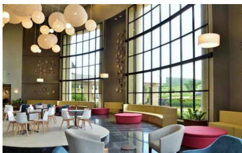
מלון EPIR בעיר הגבול Nyagatare

נסיעה לכיוון הגבול שבין רואנדה לאוגנדה, שם החל ב-1990 המאבק לשחרור רואנדה משלטון הרצחני של ההוטו שהביא לגלי רציחות של עשרות אלפי בני הטוטסי ועזיבתם של מאות אלפים בין 1959 ל-1990, ולבסוף לרצח העם ב-1994. ביקור ב-Mulindi, המקום בו החל מאבק השחרור של ה-RPF – Rwanda Patriotic Front בפיקודו של הגנרל קגאמה, נשיא רואנדה של ימינו. ביקור בבונקר בו התנהלו הקרבות ובמוזיאון מורשת הקרב ההולך ונבנה במקום. אתנחתא במפעל התה הסמוך. בהמשך ובמידה והזמן יאפשר, ביקור בעיר Nyagatare בכפר לדוגמא Model Village. נסיים את היום במלון EPIC היפהפה או דומה לו.