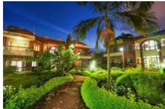
מלון Chez Lando קיגאלי