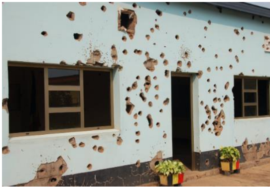
האנדרטה לזכר חיילי שמירת השלום מבלגיה

היום המשך הרצף ההיסטורי עם הגעת הקולוניאליסטים הראשונים, בשלהי המאה ה-19. סיור ב מוזיאון בית Kandt , הבית הראשון שהוקם בבירה החדשה של רואנדה, קיגאלי, ע"י המושל הראשון, הגרמני ריצ'ארד קאנדט. המשך לאנדרטה לזכר 10 חיילי שמירת השלום הבלגים שנרצחו ביום הראשון של רצח העם, טיול במדרחוב העיר. ביקור ב מוזיאון לאומנות של קיגאלי , ויציאה לעיר המחוז Bugesera וביקור ב כנסייה ובאנדרטה של Nyamata שם נרצחו 10,000 בני הטוטסי בכמה שעות ב-10 באפריל 1994. ניפגש עם מנהל האתר ונשמע עדות של ניצולה. לינה – Chez Lando