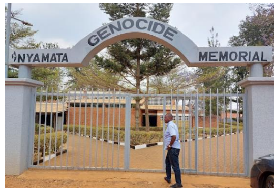
אתר ההנצחה ב-Nyamata