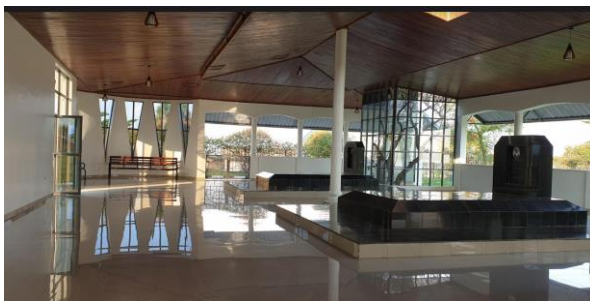
המאוזוליאום, אתר הקבורה של המלך והמלכה

יום 2 – שבת, 22.6 – Nyanza – בי"ס, ארמון המלך, מוזיאון להיסטוריה רואנדה, מוזיאון Home Grown Solutions, המוזיאום נסיעה לדרום המדינה לעיר NYANZA, הבירה של ממלכת רואנדה. ביקור בבי"ס יסודי ותיכון. ביקור בארמון המלך המסורתי ובארמון החדש, משמש היום מוזיאון להיסטוריה של רואנדה . המשך למוזיאון Home Grown Solutions וביקור ב מאוזוליאום Mwima Royal Mausoleum בו קבורים מלך רואנדה Mutara III ואשתו, שנרצחה באפריל 1994. המשך לכיוון דרום לבירה האקדמית של רואנדה, העיר HUYE/BUTARE לבית המלון לארוחת-ערב. בשני הערבים בקרובים, לינה במלון Maison Sifa .