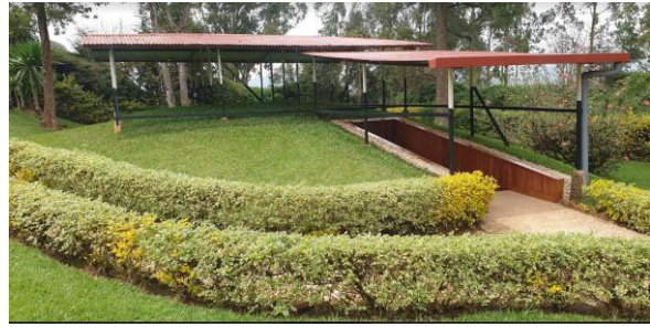
הבונקר של קגאמה, Mulindi סמוך לאוגנדה