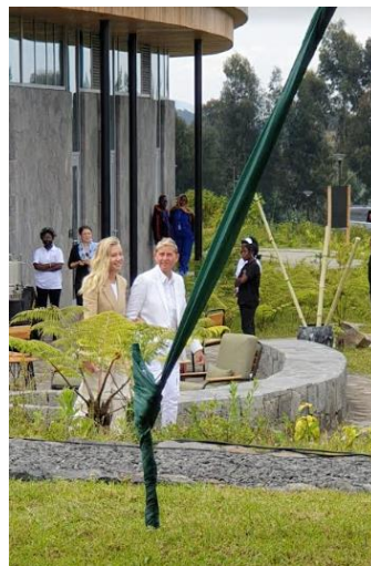
מרכז המבקרים לחקר גורילות ההרים ע"ש דיאן פוסי