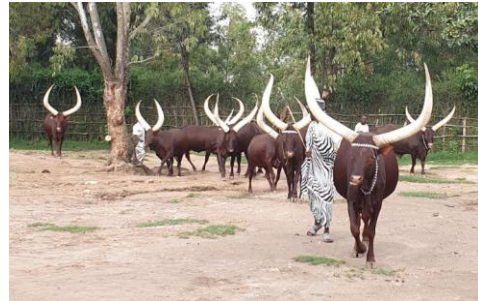
הפרות המלכותיות בארמון המלך

יום 3 – יום ראשון, 23.6 – Butare – מוזיאון הלאומי לאנתרופולוגיה, קמפוס האוניברסיטה, חזרה לקיגאלי סיור במוזיאון הלאומי לאנתרופולוגיה . ביקור במרכז המגוון הביולוגי בתוך הקמפוס האוניברסיטה של רואנדה ומפגש עם ראש המרכז, נלמד על שימור מיגוון המינים במדינה (מעל ל-7000 מיני צמחים). ביקור באתר ההנצחה של סטודנטים קורבנות הג'נוסייד, טיול ביער הקסום בו שתולים מגוון העצים האנדמים. חזרה לקיגאלי. ארוחת הערב באחת המסעדות הפופולריות בעיר.