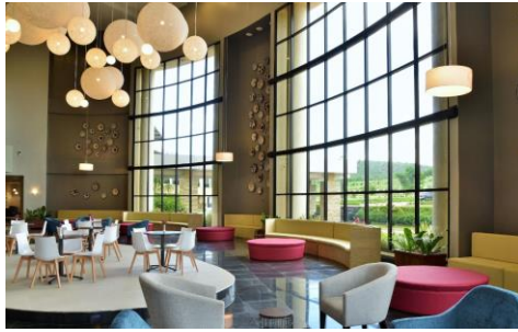
מלון EPIR בעיר הגבול Nyagatare