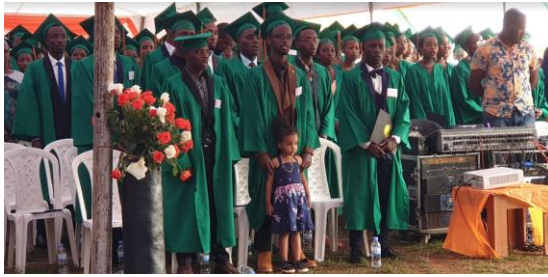
טקס סיום בית הספר "אגהזו שלום"