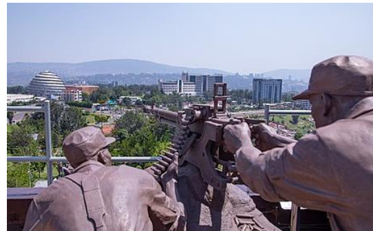
עמדת הצלפים על גג הפרלמנט, קיגאלי