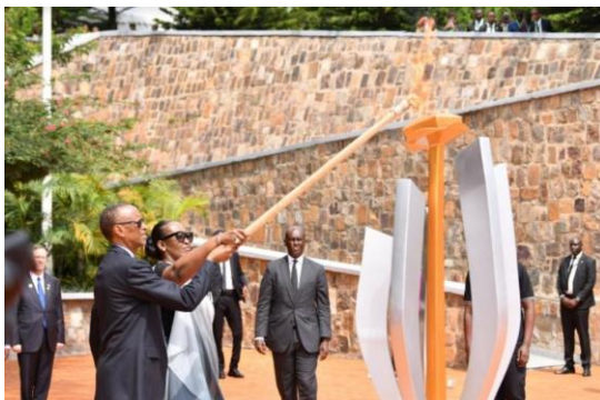
טקס הזיכרון לרגל 30 שנה לג'נוסייד

סיור במוזיאון ובאתר הזיכרון לרצח עם בקיגאלי כולל הרצאה על מנהלי המוזיאון, ארוחת-ערב במלון. לינה - Chez Lando .