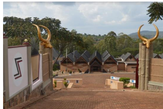
המוזיאון הלאומי לאנתרופולוגיה, Butare