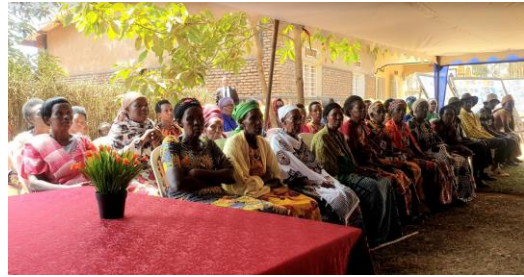
ניצולים ורוצחים יושבים ביחד בכפר פיוס