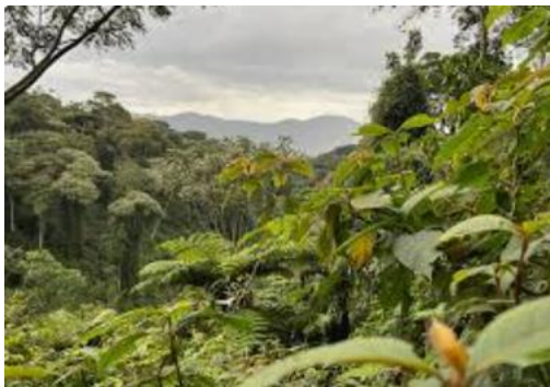
מיגוון המינים סמוך ליער הגשם Nyungwe

יום 3 – יום ראשון, 23.6 – Butare – מוזיאון הלאומי לאנתרופולוגיה, קמפוס האוניברסיטה, חזרה לקיגאלי סיור במוזיאון הלאומי לאנתרופולוגיה . ביקור במרכז המגוון הביולוגי בתוך הקמפוס האוניברסיטה של רואנדה ומפגש עם ראש המרכז, נלמד על שימור מיגוון המינים במדינה (מעל ל-7000 מיני צמחים). ביקור באתר ההנצחה של סטודנטים קורבנות הג'נוסייד, טיול ביער הקסום בו שתולים מגוון העצים האנדמים. חזרה לקיגאלי. ארוחת הערב באחת המסעדות הפופולריות בעיר.