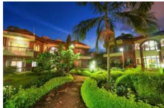
מלון Chez Lando קיגאלי