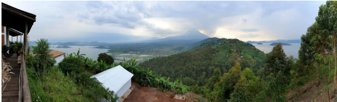
הנוף המרהיב של שני האגמים התאומים Burera ו-Ruhondo והר הגעש Muhavira